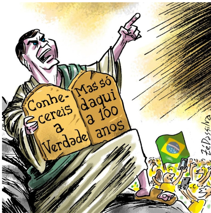
Imagem 04: Conhecereis a verdade.

presidente, entre eles, sua carteira de vacinação 8 . Tal contradição é incisivamente criticada em uma charge de Zé Dassilva 9 , publicada em 18 de abril de 2022, na qual Bolsonaro é representado em alusão à figura bíblica de Moisés, segurando tábuas da lei e proclamando: “Conhecereis a Verdade, mas só daqui a 100 anos”.