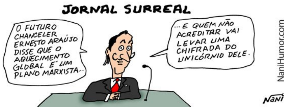
Imagem 02: Jornal Surreal.

Na charge Jornal Surreal (19 nov. 2018), um jornalista de aparência caricata, com bigodes que remetem ao pintor surrealista Salvador Dalí, noticia: “O futuro chanceler Ernesto Araújo disse que o aquecimento global é um plano marxista...”, para em seguida completar: “... e quem não acreditar vai levar uma chifrada do unicórnio dele”.