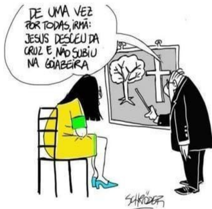
Imagem 03: Jesus e a Goiabeira.

Damares Alves também fez menção a episódios de abuso que sofreu e comentou que, apesar das dores, encontrava conforto espiritual: “não por mim, tenho meu consolador, e queiram vocês ou não, ele sobe no pé de goiaba” (Youtube, 2019). Essa afirmação, aparentemente desconexa, remete a uma narrativa que a ministra compartilhara em um congresso evangélico: aos dez anos de idade, teria presenciado Jesus Cristo subindo em uma goiabeira, uma árvore muito comum no Brasil, fato que, segundo ela, atestaria o poder divino de superar as limitações físicas (Poder 360, 2018).